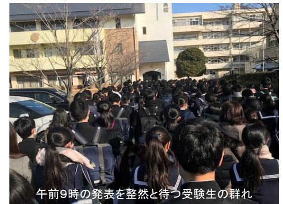
午前9時の発表を整然と待つ受験生の群れ